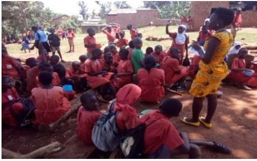
Foto: Schoolbezoek UMEA