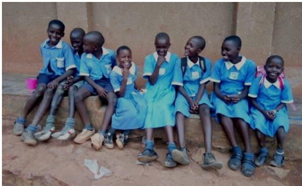
Foto: Weeskinderen tijdens bezoek Project Officer op een van de scholen