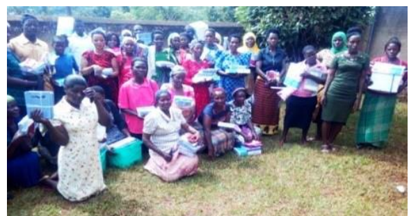
Foto: Eén van de succesfactoren van NUW/CHISOM: de verzorgers helpen bij hun alledaagse problemen en betrekken bij schoolactiviteiten