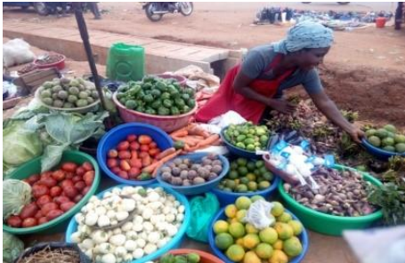
Foto: Verbouwen en verkopen van groenten en fruit