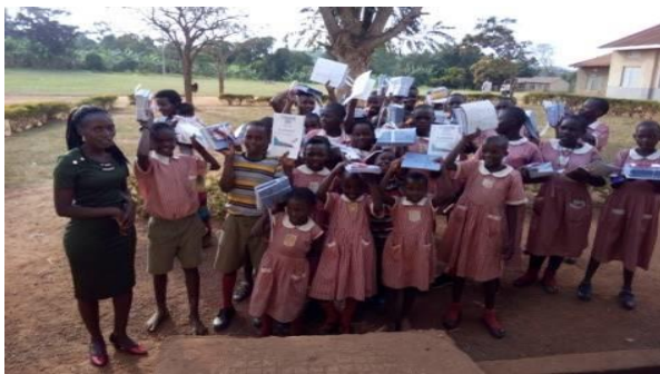
Foto: Weeskinderen van St.Kizito met schoolmateriaal verstrekt door CHISOM