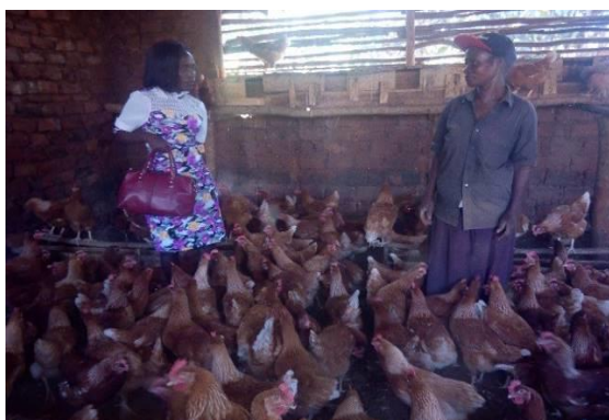
Foto: Kippen zorgen voor inkomsten